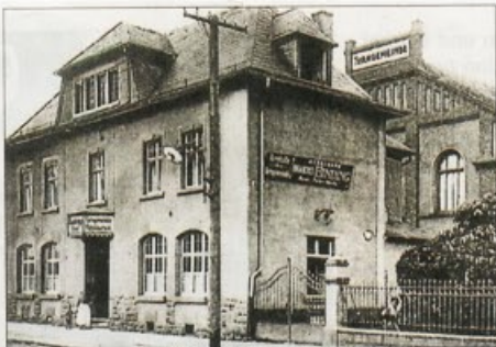
Die Vereinshäuser mit ihren großen Sälen spielten einst eine bedeutende Rolle in der Hugenottenstadt.